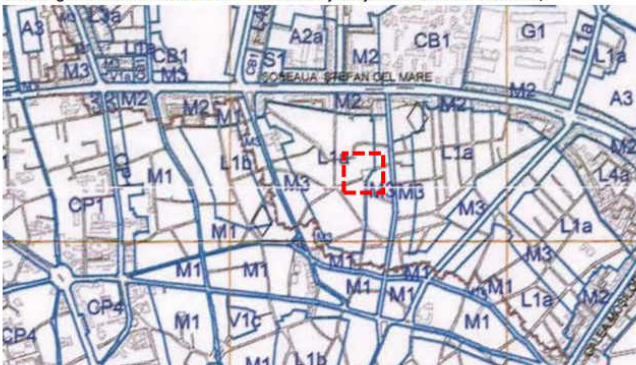
Extras din PUG Municipiul București, aprobat prin HCGMB nr 269/2000

Terenul este încadrat conform PUG Municipiul București în UTR M3 - subzona mixtă cu clădiri având regim de construire continuu sau discontinuu și înălțimi maxime de P+4 niveluri.;