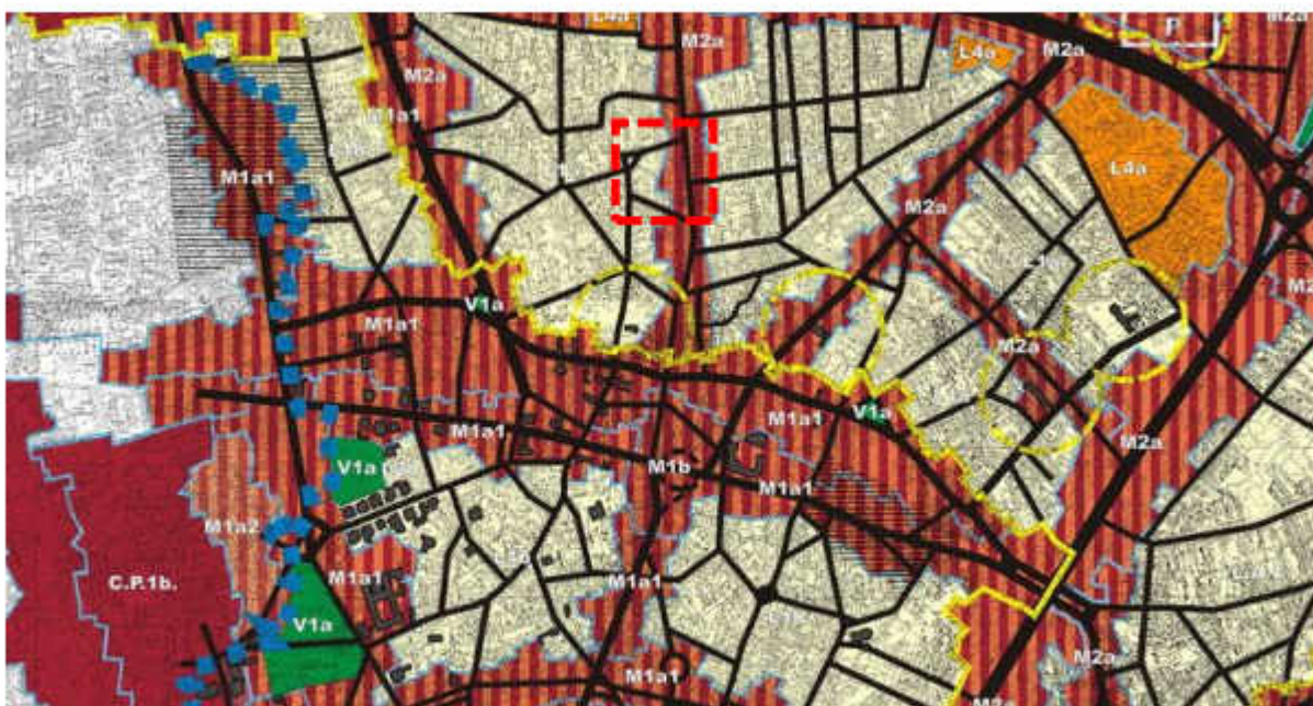
Extras din PUZ Sectorul 2, aprobat prin HCL nr 99/2003, în prezent expirat

Urmare a suprafetei terenurilor de referinta pentru care s-a introdus solicitarea, dar si a adiacentei fata de intersectia unor strazi, corelate cu frontul posterior existent de asemenea in M, terenul este încadrat conform PUZ Sectorul 2, aflat în etapa de avizare, în UTR M - zonă mixtă , impreuna cu parcelarul tip insular din care este parte componenta.