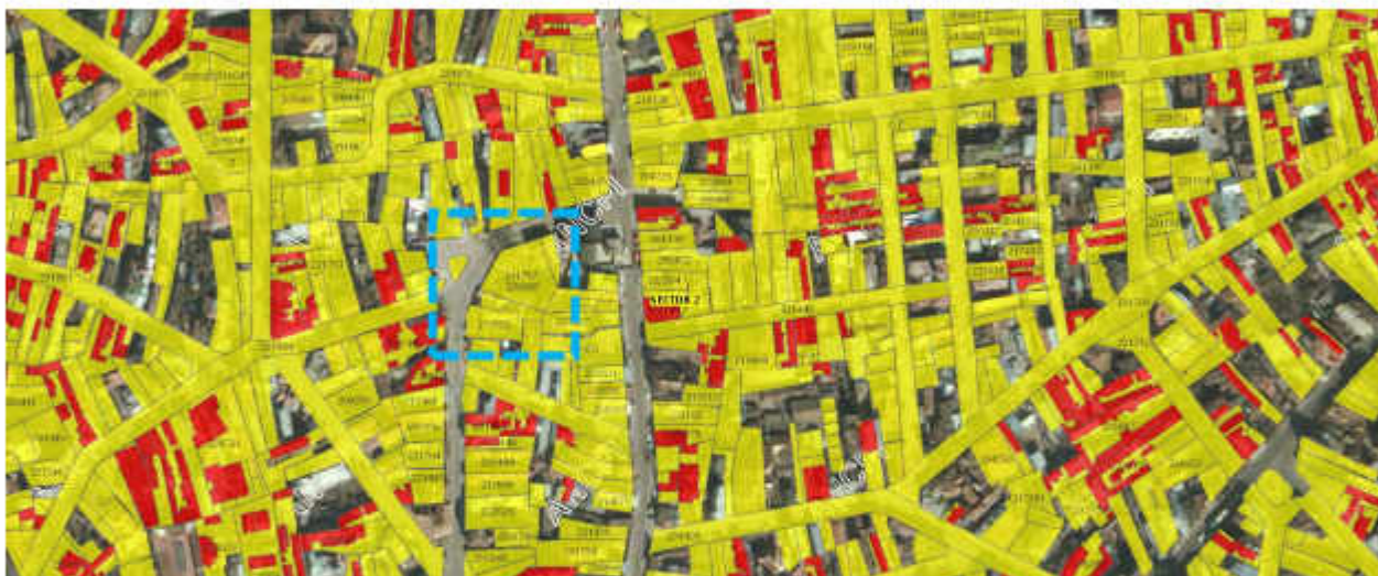
Extras din încadrare în ANCPI, imobile E-terra

Terenul este încadrat conform PUG Municipiul București în UTR M3 - subzona mixtă cu clădiri având regim de construire continuu sau discontinuu și înălțimi maxime de P+4 niveluri.;